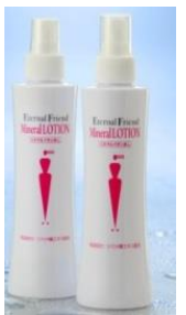
ミネラル ローション