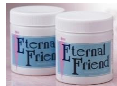
マッサージソルト

あたたかなお湯で肌が柔らかくなったら、ヒジ・ヒザなどの角質ケアを。優しくマッサージする事で血行を促進、代謝機能の活性化なども。