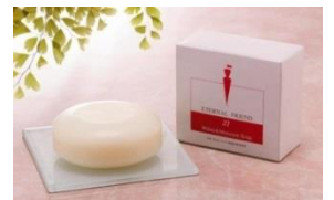
ホワイト& モイスターソープ